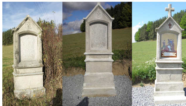
Stav roku 2009