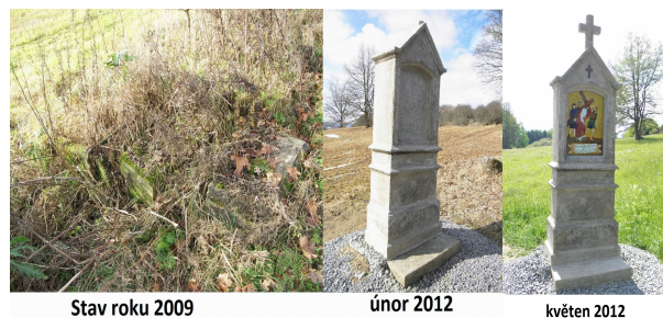
Stav roku 2009

Zastavení č.V /stav r.2009, únor 2012, květen 2012/