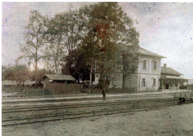
Zřejmě foto samotného přednosta. Díky špatné kvalitě snímku se nedá identifikovat.