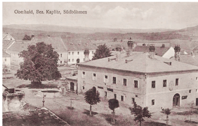
Foto pivovaru z věže kostela, z boku je vidět označení radnice. /r. 1929/

Sládkem a nájemcem pivovaru v Horním Dvořišti byl v roce 1880 Kašpar Tobisch. Následně však ještě před koncem 19. století obecní pivovar v Horním Dvořišti zanikl. Zdá se, že příčinou bylo úmrtí sládky, jehož život končí v roce 1886.